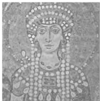
Византийская мозаика (XIII в.)